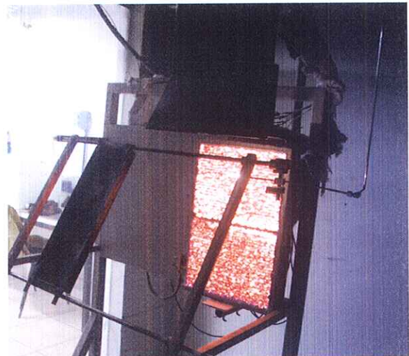
Figura 1: Equipamento de ensaio

Os corpos de prova, com dimensões de 150 \pm 5 mm de largura e 460 \pm 5 mm de comprimento, são inseridos em um suporte metálico e colocados em frente a um painel radiante poroso, com 300 mm de largura e 460 mm de comprimento, alimentado por gás propano e ar. O conjunto (suporte e corpo de prova) é posicionado em frente ao painel radiante com uma inclinação de 60^\circ , de modo a expor o corpo de prova a um fluxo radiante padronizado. Uma chama piloto é aplicada na extremidade superior do corpo de prova.